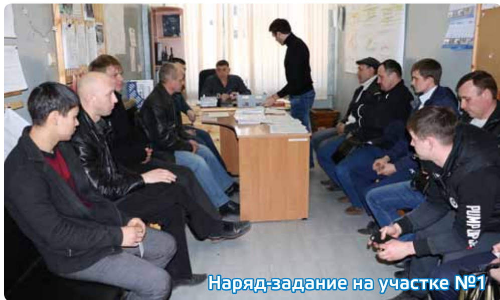
Наряд-задание на участке №1

промплощадку едем, чтобы сделать общее фото бригады. Собрать 6 человек коллектива в одном месте, даже рабочем, невозможно. Пока один на смене, второй готовится заступить, третий отсыпается. Бригада работает, не прекращая процесс добычи руды 24 часа в сутки. Поэтому кое-кому пришлось пожертвовать своим выходным, кому-то