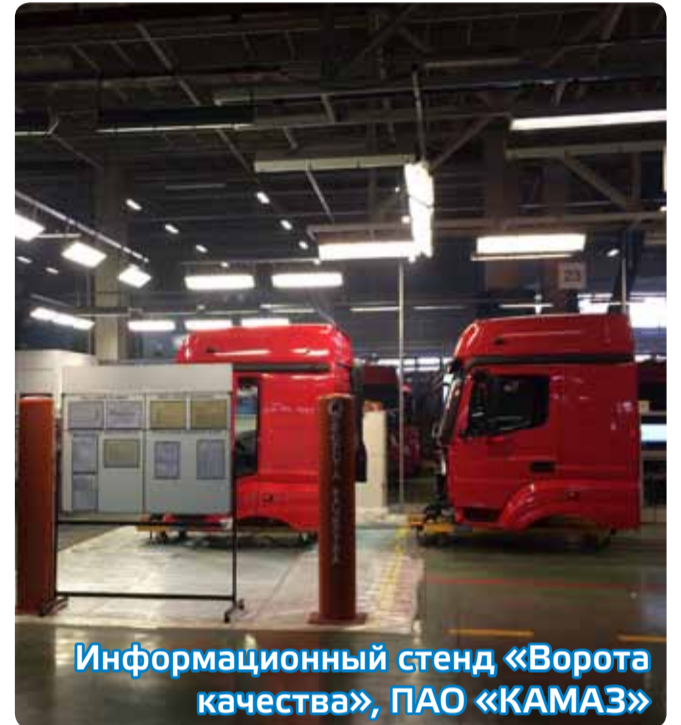
Информационный стенд «Ворота качества», ПАО «КАМАЗ»

«Мы не навязываем предложения по улучшениям, как это делалось ранее. Теперь участники сами выби-