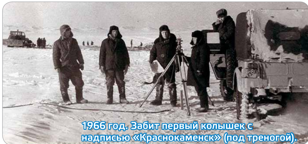
1966 год. Забит первый колышек с надписью «Краснокаменск» (под треногой).

...Многочисленные рукописные тома в архиве ОКСа с короткими записями на пожелтевших и изрядно потрепанных страницах стали бесценной реликвией Краснокаменска.